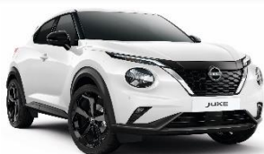
326 BIJELA (NEMETALIK)