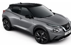
XEX CERAMIC SIVA- METALIK CRNI KROV