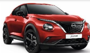
Z10 CRVENA (NEMETALIK)