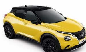
YAS ŽUTA- METALIK CRNI KROV