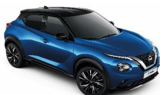
XGZ MAGNETIC PLAVA- METALIK CRNI KROV