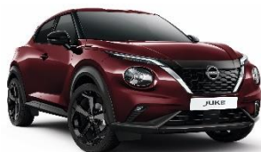
NBQ BURGUNDY CRVENA