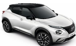
XKJ PEARL BIJELA- METALIK CRNI KROV

Opcija na razini opreme opreme N-CONNECTA i TEKNA, Serija na razini opreme N-DESIGN i N-SPORT