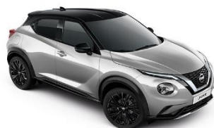
YAV BLADE SREBRNA- METALIK CRNI KROV