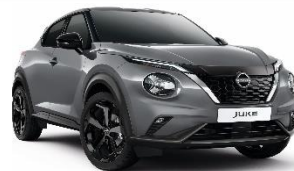
KBY CERAMIC SIVA