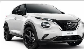
QBE PEARL BIJELA (PERLA)