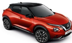
YAU FUJI SUNSET- METALIK CRNI KROV