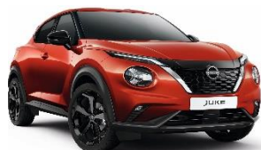
NBV FUJI SUNSET