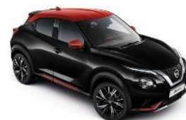
YAX CRNA METALIK- FUJI SUNSET KROV