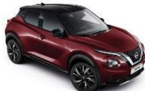
XDQ BURGUNDY CRVENA- METALIK CRNI KROV