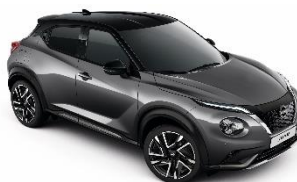
GAQ GUN SIVA - METALIK CRNI KROV