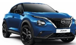
RCF MAGNETIC PLAVA