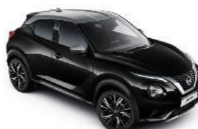
YAY CRNA METALIK- BLADE SREBRNI KROV