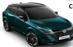
DEEP OCEAN / CRNI KROV (YBJ)