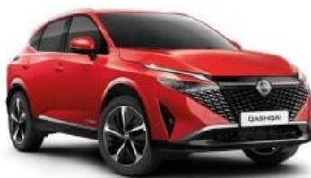
FUJI SUNSET (NBV)