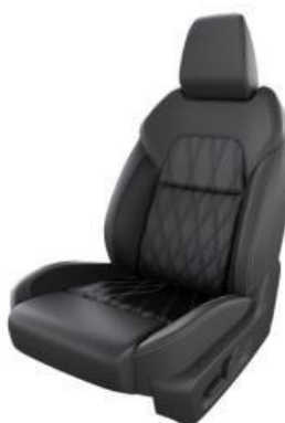
NAPPA KOŽNA SJEDALA (Z)