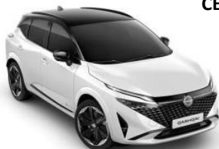
PEARL BIJELA / CRNI KROV (XKJ)