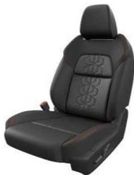
PRESVLAKE OD CRNE EKO KOŽE (H)