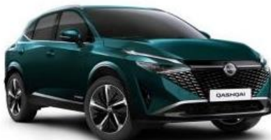
DEEP OCEAN (FAP)