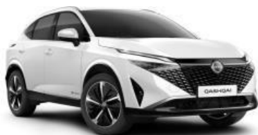
PEARL BIJELA (QBE)