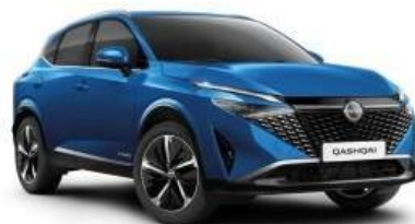
MAGNETIC PLAVA (RCF)