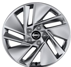
17" ALUMINIJSKI NAPLATCI