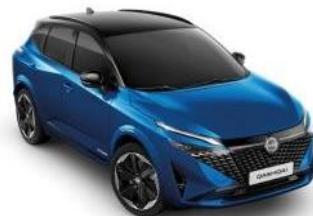
MAGNETIC PLAVA / CRNI KROV (XGZ)