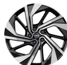
20" ALUMINIJSKI NAPLATCI