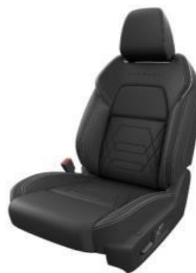
PRESVLAKE U KOMBINACIJI CRNE PROŠIVENE KOŽE I ALCANTARE (Z)