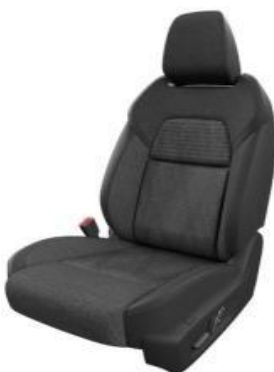
PRESVLAKE U KOMBINACIJI CRNE TKANINE I EKO KOŽE (G)