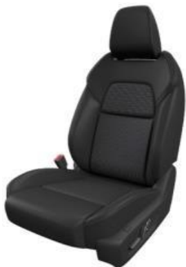
PRESVLAKE OD CRNE TKANINE (G)