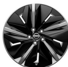
19" ALUMINIJSKI NAPLATCI