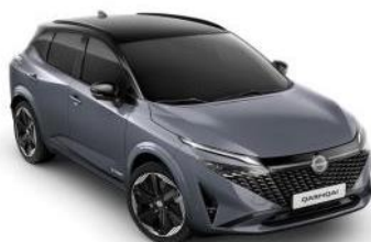
CERAMIC SIVA / CRNI KROV (XEX)