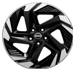
18" ALUMINIJSKI NAPLATCI