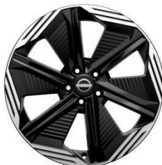
20" ALUMINIJSKI NAPLATCI N-DESIGN