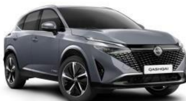
CERAMIC SIVA (KBY)